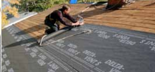
Надёжное применение по сплошному настилу.